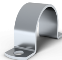
Tillbehörsklammer 28 mm