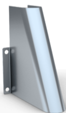
Fot 28 mm